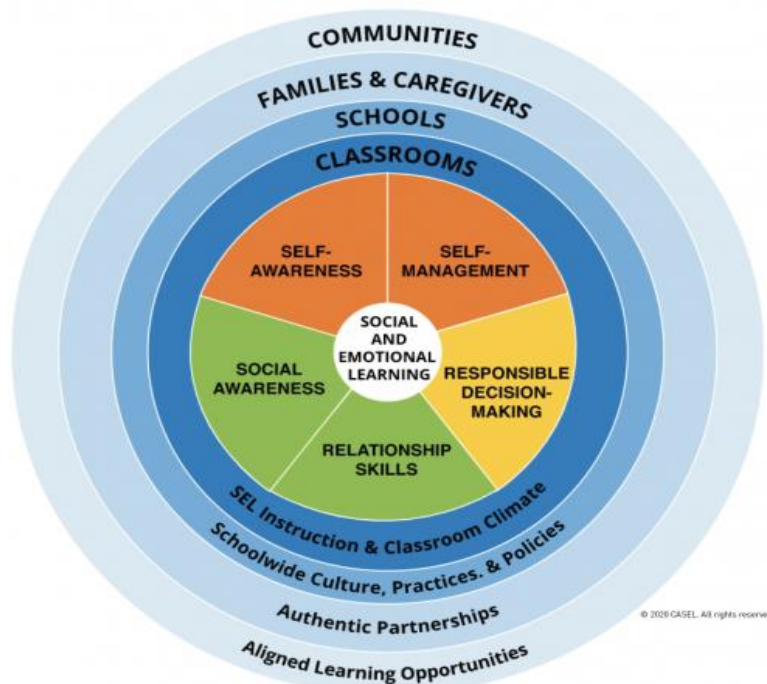
Рисунок 2. «Колесо компетенций CASEL 5».

Основные компетенции CASEL в области социального и эмоционального обучения охватывают пять наборов когнитивных, аффективных и поведенческих компетенций, представленные в виде модели и получившие условное название «Колесо компетенций CASEL 5» (рисунок 2)